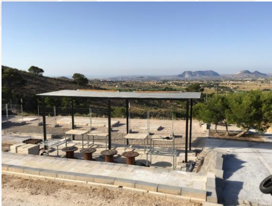
Zona de Pilotos