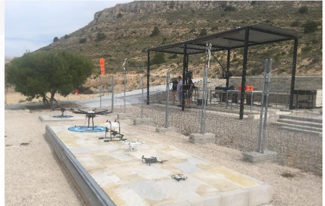
Zona de Pilotos - Pistas